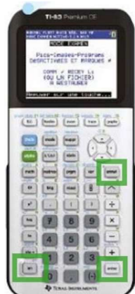
TI 83 CE