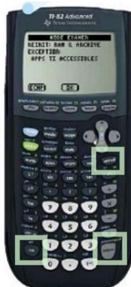
TI 82 Advanced