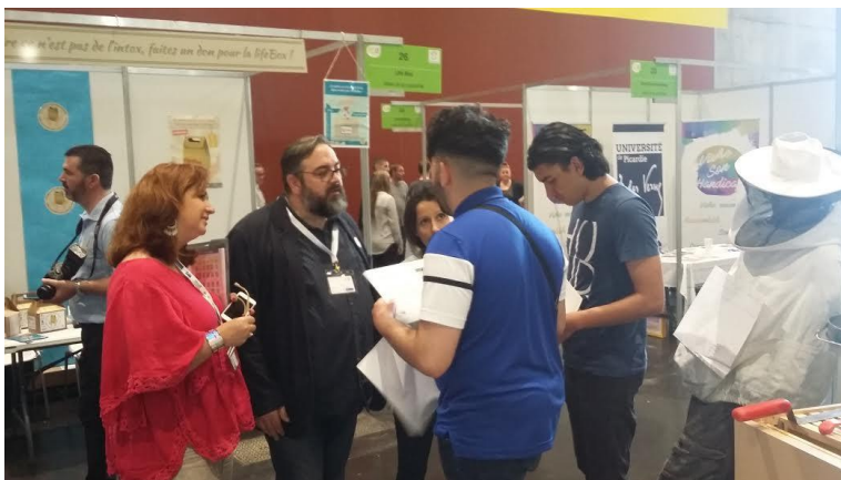
Les élèves du lycée Turgot en train de défendre leur chance devant les membres du jury

A l'année prochaine pour l'édition 2018 !